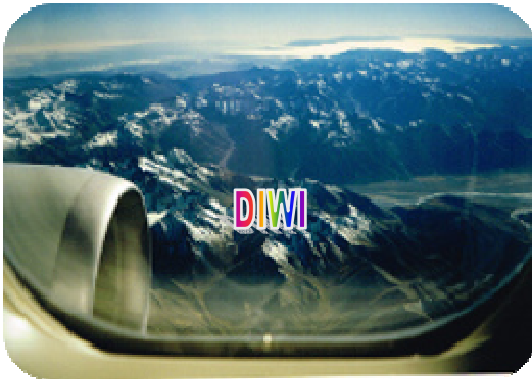
Flug über die Südalpen