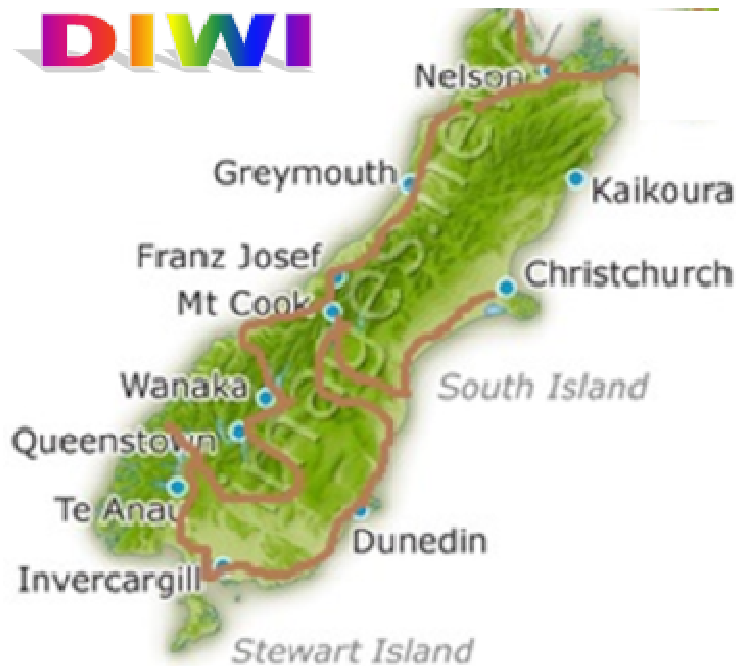
New Zealand Map South Island Reiseroute: Dieter Wiedelmann

Start ist in der "Gartenstadt" Christchurch auf der Südinsel.